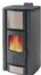
Maiolica sale e pepe e fianchi antracite cod. K7002