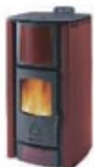
Maiolica rossa e fianchi rossi cod. K7001