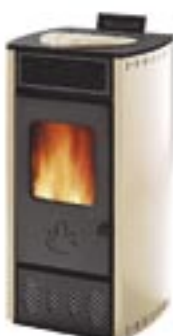
Beige cod. A1002