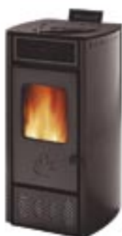
Antracite cod. A1003