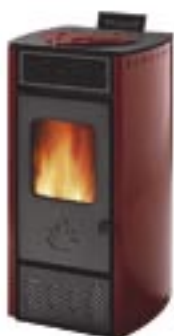
Rosso cod. A1001