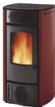
Rosso cod. A2030