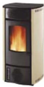
Beige cod. A2032