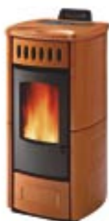
Terra d'Oriente cod. A6352