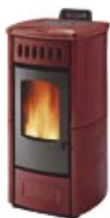
Rosso cod. A6350