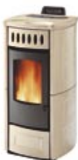
Sale e pepe cod. A6351