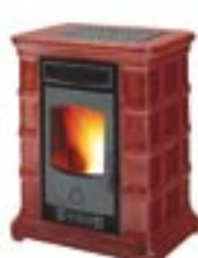
Rosso cod. A3003

DIMENSIONI: 800X590X990 SCARICO FUMI: Ø 80 CAPACITA' SERBATOIO: 23 KG RENDIMENTO TERMICO: 82% POTENZA NOMINALE: 10 Kw CONSUMO: 0,8-2,4 Kg/h ALIMENTAZIONE ELETTRICA: 90/230 w PESO: 185 Kg PRESA D'ARIA: Ø 50