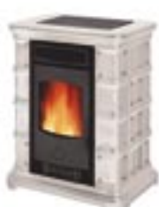
Bianco decoro cod. A3001