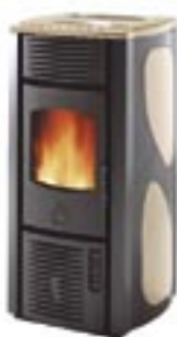
Sale pepe cod. A6051