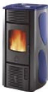
Blu cod. A6052