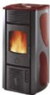
Rosso cod. A6050