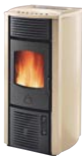
Beige cod. A6042