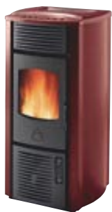
Rosso cod. A6040