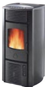
Antracite cod. A6041