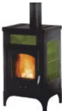
verde cod. LE4001