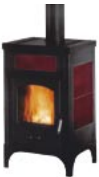
Rosso cod. LE4000