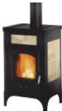
Sale e pepe cod. LE4003