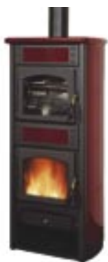
Rosso cod. LE2000