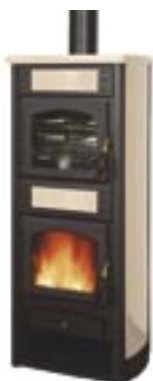
Sale e pepe cod. LE2001