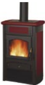
Rosso cod. LE2000