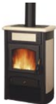
Sale e pepe cod. LE2001