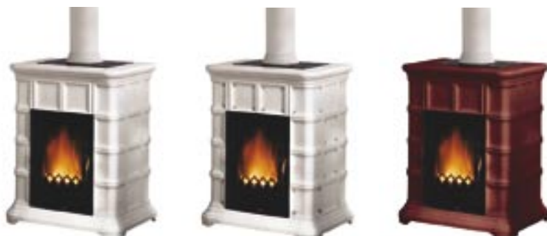
Rosso cod. A6040