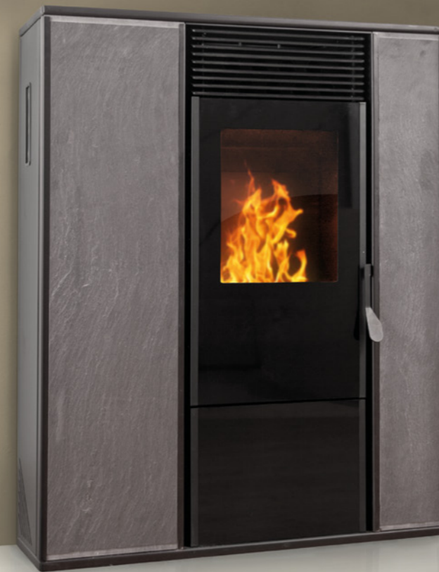
stufa a pellet Alice con finitura in pietra ardesia

DESIGN INTENSO COME SINTESI DI ESTETICA, FUNZIONE E COMFORT