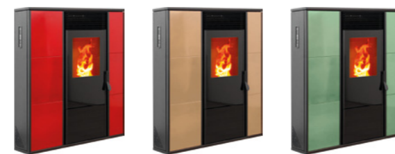
Rosso Codice: E7000