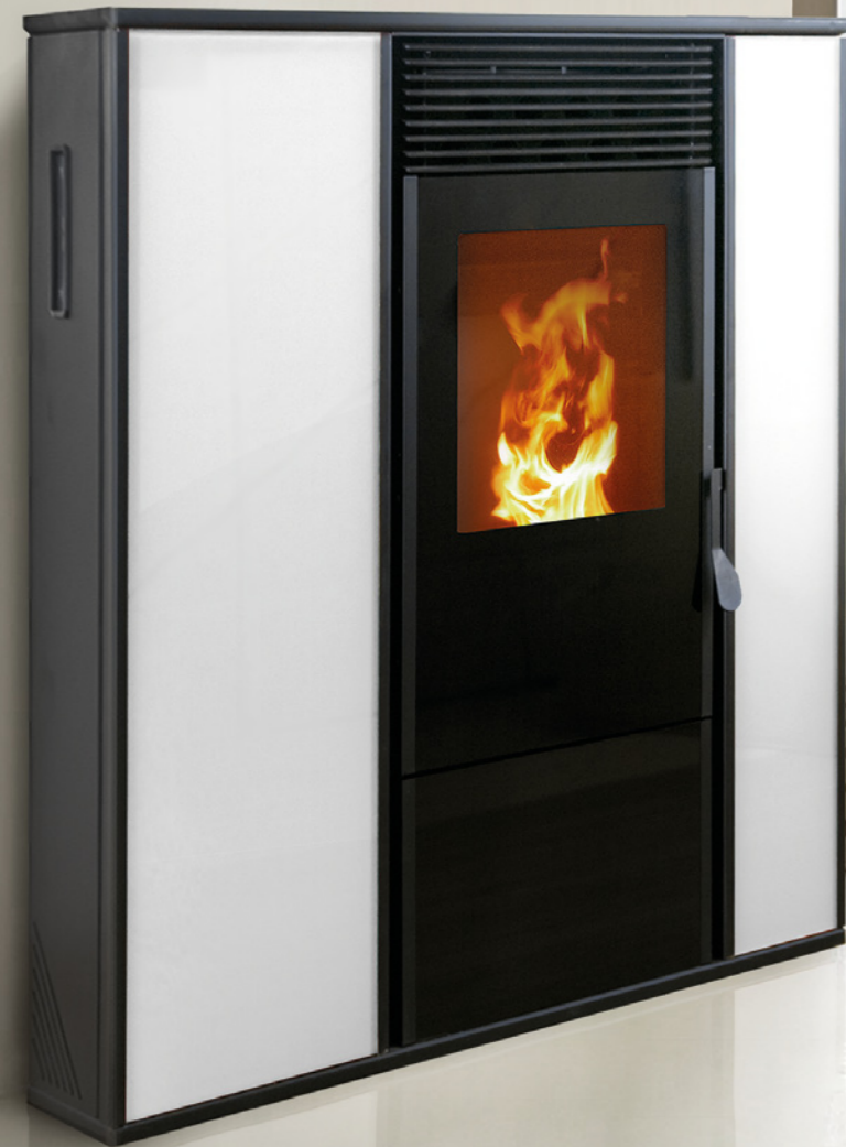
stufa a pellet Alice con finitura in vetro bianco