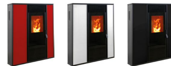
Rosso Codice: E7010