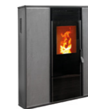
Pietra Ardesia Codice: E7010